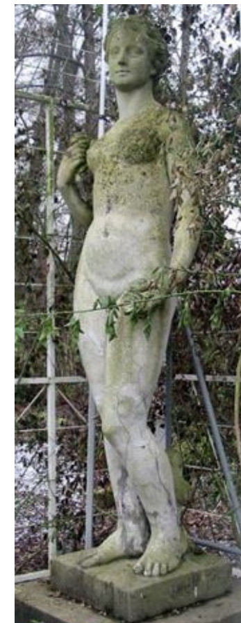
Flora aus dem Rosengarten Zweibrücken